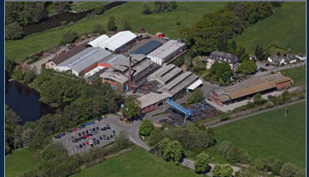
Stammwerk und Fertigung in Hatzfeld (Eder) Központi üzem és gyártás Hatzfeld (Eder) városában

▼ FRANK Walz- und Schmiedetechnik GmbH Frankstraße 1 / Reddighäuser Hammer 35116 Hatzfeld (Eder) GERMANY